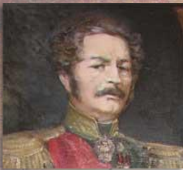
Н.Н. МУРАВЬЕВ генерал-губернатор Восточной Сибири

В апреле 1853 года по решению императора Николая I была определена новая государственная граница на Дальнем Востоке, левобережье Амура объявлялось владением России.