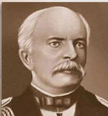
адмирал Г.И. НЕВЕЛЬСКОЙ

В начале XIX века русское правительство предприняло еще одну попытку решить амурский вопрос. Фактически это была ничейная земля.