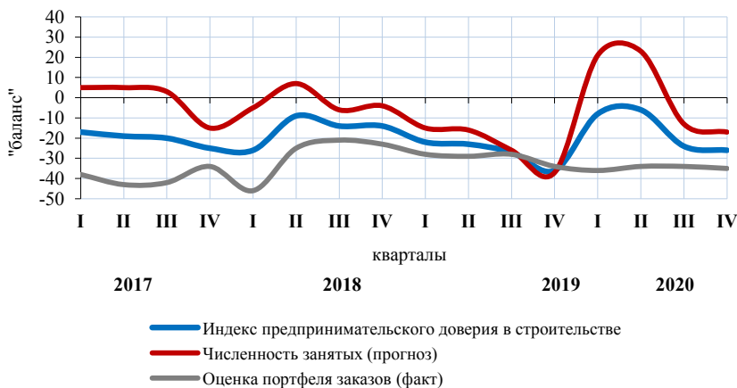
Динамика индекса предпринимательской уверенности в строительстве (в процентах)

Средний уровень загрузки производственных мощностей строительных организаций в IV квартале 2020 года составил 64% (в предыдущем квартале - 64%).